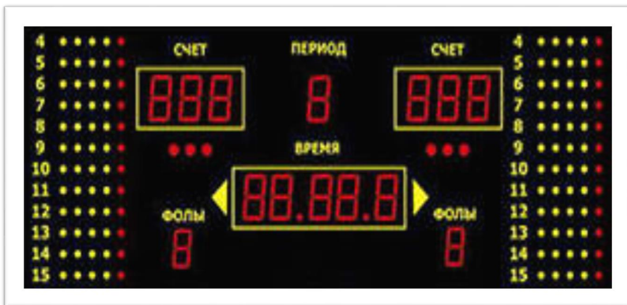
Рис. 3. Табло для счета (пример оборудования)

Помощник секретаря управляет табло счета (рис. 3) и помогает секретарю основного протокола. В случае любого расхождения между записью в протоколе и показанием на табло и невозможности установить причину этого расхождения, за истину принимаются записи, указанные в протоколе, в соответствии с которыми должны быть исправлены показания табло.