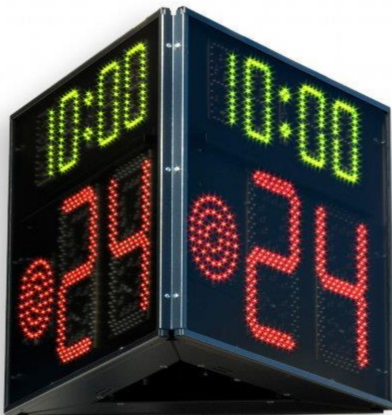
Рис. 4. Устройство 24 секунд

В распоряжение оператора устройства двадцати четырех (24) секунд должно быть предоставлено устройство двадцати четырех (24) секунд, которым он должен управлять следующим образом (рис. 4):